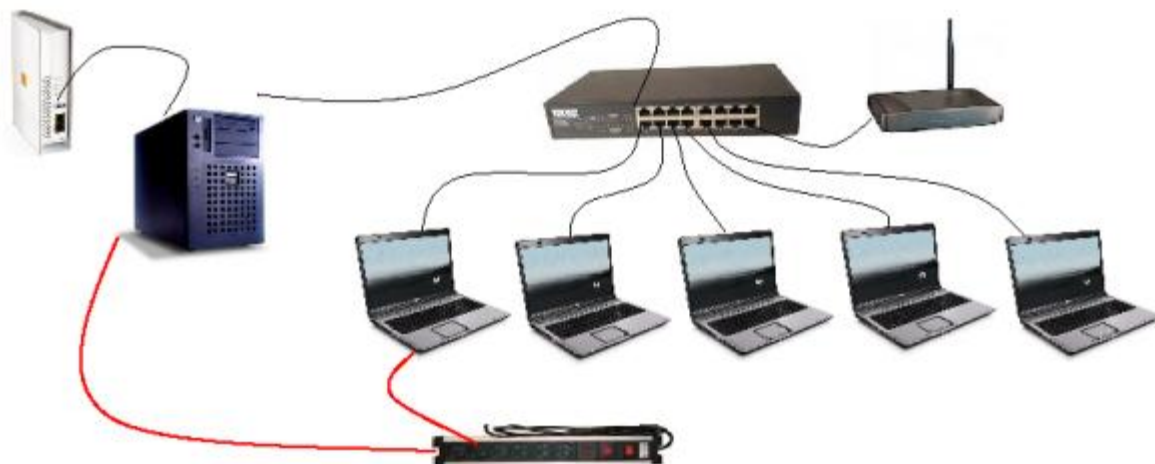
Mise en place du pack informatique avec câblage